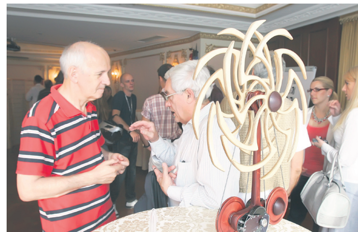
Модели изума српског генија на поставци у хотелу „Москва“ уприличеној поводом обележавања 158. годишњице рођења великана науке