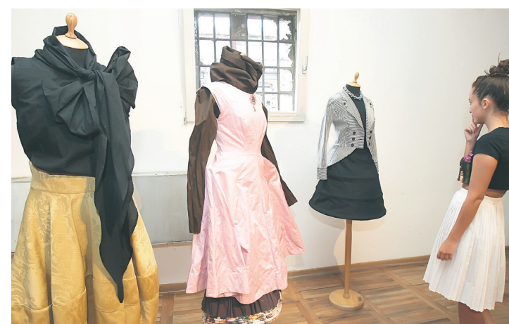
Продајна летња изложба у КЦ „Град“