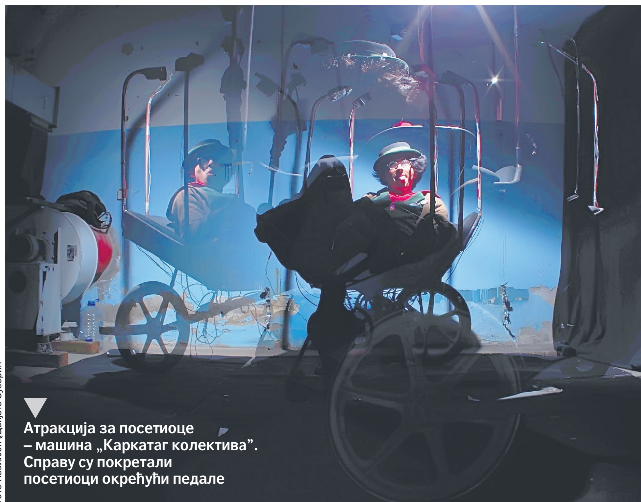
Атракција за посетиоце – машина „Каркатаг колектива“. Справу су покретали посетиоци окрећући педале