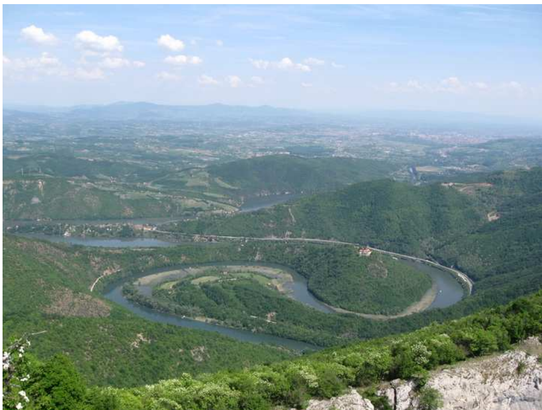
Природна "Јин-Јанг" формација, јединствена у свету

Када се погледа са врха Каблара, човеку застаје дах од предивног призора: меандри Западне Мораве и црвени кровови овчарско-кабларских манастира: Благовештење, Илиње, Успење, Вознесење, Св.Тројица, Сретење и Преображење.