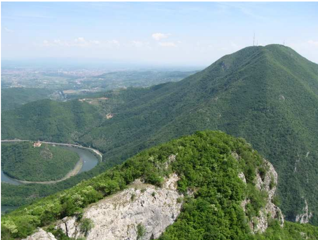
Врх Каблара, стена у првом плану, а иза њега је врх Овчара

Одатле, са 600 m nl, креће се на пешачење ка врху Каблара (885 m nl), стазом дугом 2 km , кроз воћњаке и шуму. Стаза се, обично, препешачи за 40 минута лаганог хода.