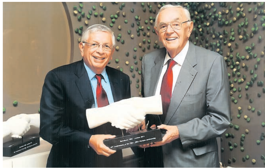
Ујединитељи светске кошарке: Бора Станковић (десно) и Дејвид Штерн у Лондону 2012, када им је обојици одато признање

Последнице грађанског рата у Кини осећале су се дуго и у спорту, па и у кошарци. Зато је Станковић одлазио у „обе” Кине да би се проблем решио: