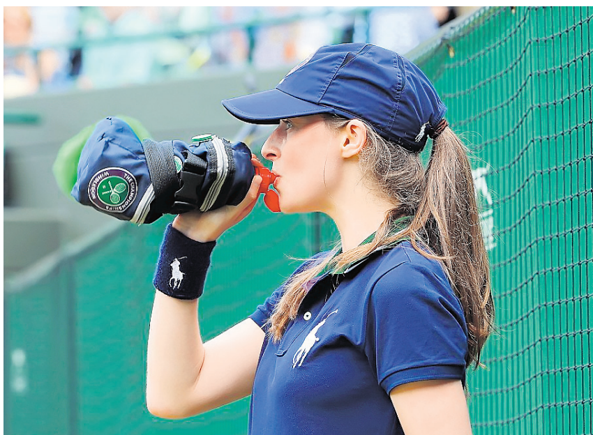
Тражи се девојчица која је „нервозно пила воду, образа црвенијих него иначе”

Занимљив је медијски процес обраде једног вриска. У наредним репродукцијама приче без видљивих доказа, девојчица је „уплакана и ћутљива до краја меча”, а наслови изненада повезују догађај са „оптужбама за расистичке изјаве Кириоса”, неколико дана раније. Читаоцу остаје само да и Ђоковићево понашање повеже са расизмом, свеједно што је нагло про-