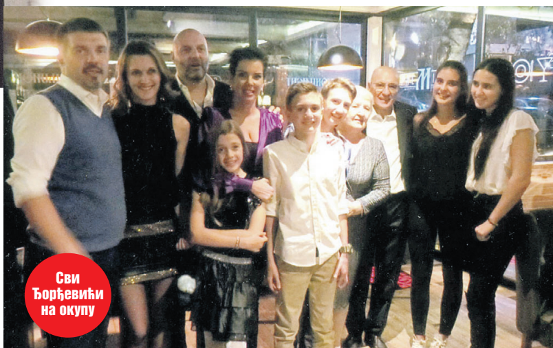
Сви Ђорђевићи на окупу

Имали смо заказану турнеју по Италији, али ме је у Београду возећи веспу ударио аутомобил и тешко повредио, но нисам одустао од пута и у Рагузи су ме прогласили за најбољег, иако сам играо без патика