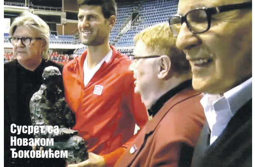
Сусрет са Новаком Ђоковићем