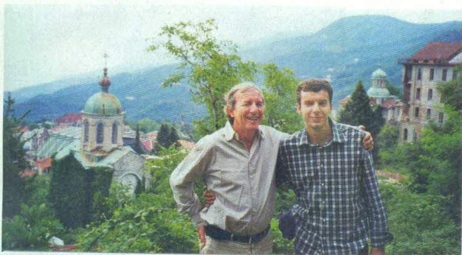
На Светој гори је био три пута, али планира још одлазака

треба благовремено излечити, јер ће се проширити, а тада од тога може да настане и гангрена и друге компликације. Онда је лечење и скупље и теже. Превентива је јефтинија и ефикаснија!