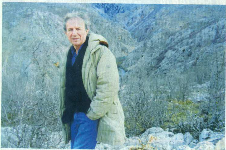
У родном крају, у кањону Зрмање