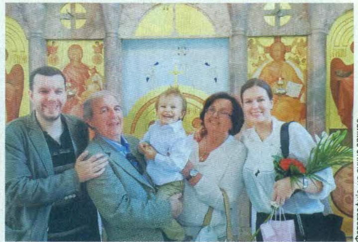
Стигли су и унуци, највећа радост и разонода