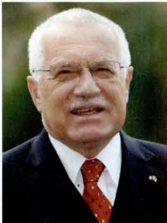
Пореди ЕУ са бившим Совјетским Савезом, а бриселску бирократску „елиту“ са Централним комитетом Комунистичке партије, кога нико није бирао, а који доноси одлуке о животу милиона: Вацлав Клаус, председник Чешке

ни на видику. ЕУ је морала да позове и „Међународни монетарни фонд“ (ММФ) у помоћ. Полазећи од чињенице да су грађани, привреда и државе презадужени, и да је достигнут плафон у могућности задуживања, реално нема начина да се отплати ни интерес на ове кредите, а поготово не главница. Како је циљ да се укупна задуженост смањи, то је могуће остварити само на два начина: први је да се допусти да дужници банкротирају, што доводи и до банкротирања банака поверилаца, а и до колапса целокупне финансијске економије. То Запад тренутно не може себи да приушти. Други начин је да се настави са убав-