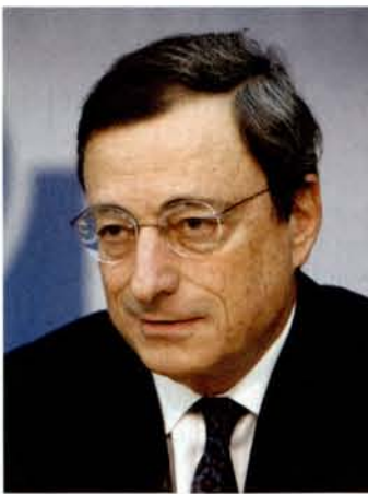
Не жели да спасава чланице еврозоне које су упале у дужничку кризу: Марио Драги (Mario Draghi), председник „Европске централне банке“

НЕМАЧКА ЕВРОПА Решење политичке, економске и фискалне кризе у еврозони није