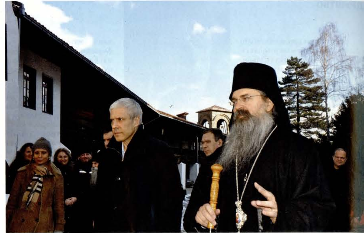
Председник Тадић, његова влада и присталице су се до те мере заглибили у ЕУ бласто да су угрозили судбину и живот сто хиљада Срба на Космету

У КАНЦАМА ГЛОБАЛИЗАЦИЈЕ Из горе наведеног јасно произлази да је ЕУ брод који тоне. Србија при доношењу одлуке да ли да и даље настави процес придруживања ЕУ мора добро да размисли и сагледа реалну слику ЕУ, јер они идеали на којима је створена ЕУ одавно већ не постоје, 20 протеклих година релативног просперитета ЕУ се неће ускоро поновити, а следећих 20 година могу да доведу до страховитих ломо-