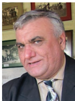
Најдостојније место на којем би земаљски прах Николе Тесле требало да почива јесте Храм Светог Саве на Врачару: Божидар Раденковић