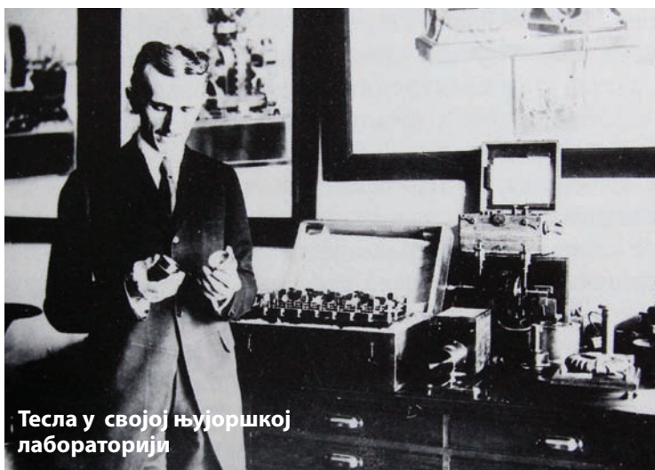
Тесла у својој њујоршкој лабораторији