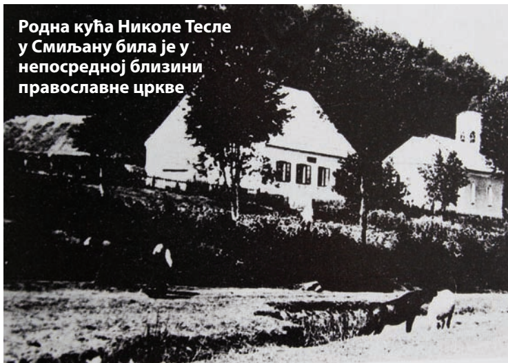
Родна кућа Николе Тесле у Смиљану била је у непосредној близини православне цркве