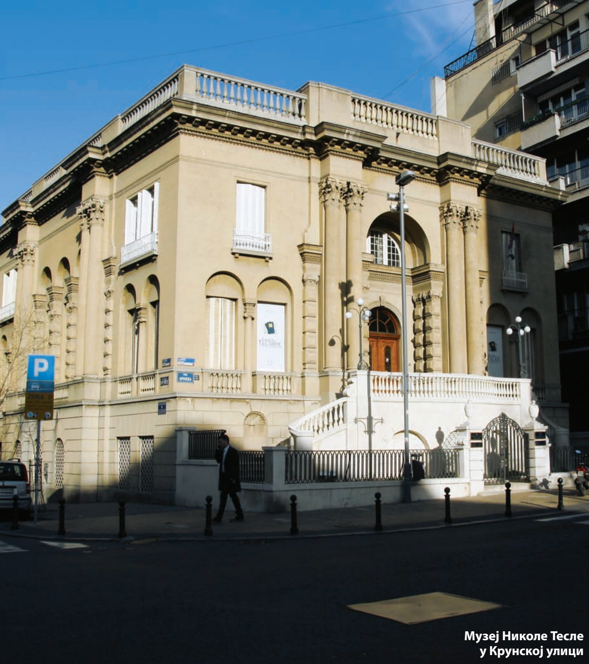
Музеј Николе Тесле у Крунској улици