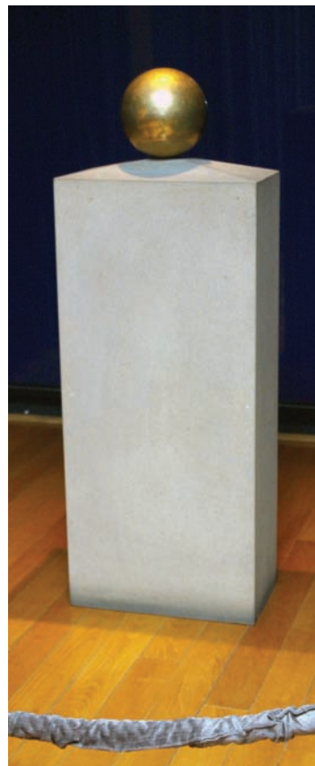
Урна Николе Тесле као експонат у „кутку“ музеја

„Управни одбор Музеја Николе Тесле са жаљењем констатује да нико од доносилаца ове одлуке није консултовао нити стручњаке Музеја Николе Тесле у Београду о овом питању, као ни УО Музеја као