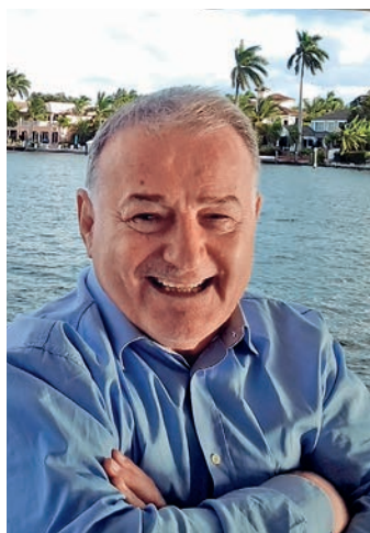
6 У Мајамију летос