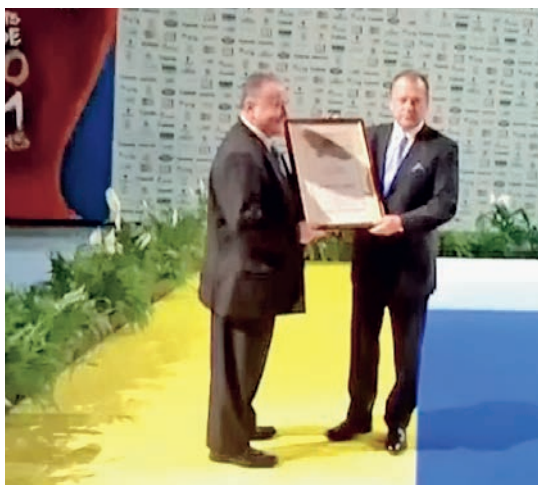
Легенде џуда из Србије