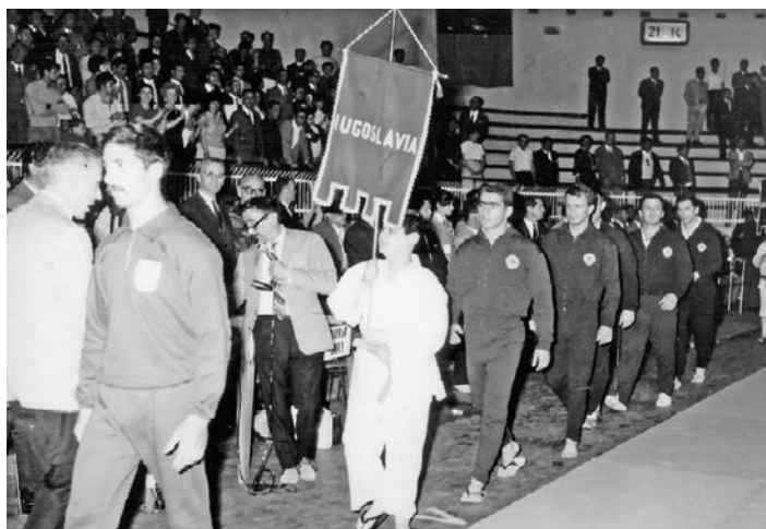
На Европском првенству у Риму 1967

– Мени је та година била изузетна. Предавао сам историју, француски језик, краснопис, физкултуру и певање. То са певањем било је смешно јер нисам успевао да ухватим ни мелодију песме „Под Ловћеном зелени се трава“, али смо певали. Најлепша анегдота је у вези са историјом. Инспектор је питао ученика шта зна о Спартаковом устанку и дечко као из пушке преслика моју реченицу: „Спартак је поткопао темеље Римске империје.“ Инспектор, импресио-