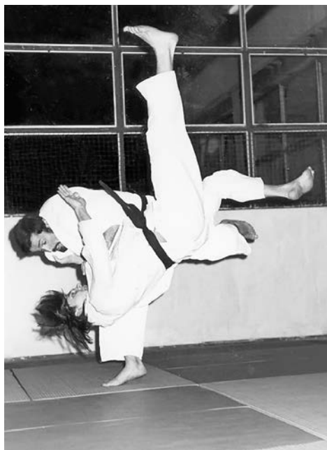
Демонстрирање технике 1972.