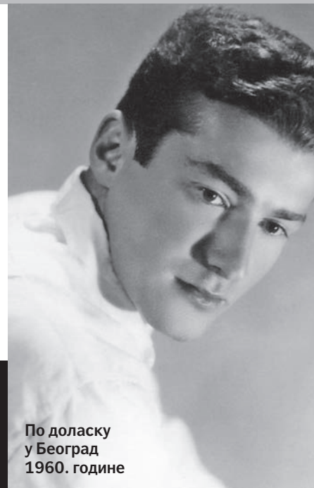
По доласку у Београд 1960. године

Због познатог џудисте 20 пута је интонирана наша химна на светским и европским шампионатима света. Иначе је први почасни професор на Факултету спорта и физичке културе и ради и као телевизијски репортер