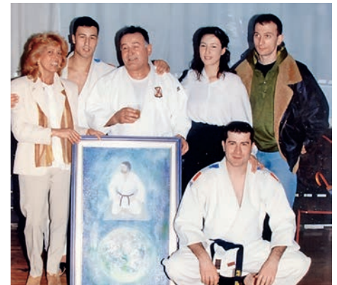
Признање поводом четири деценије бављења џудом 1999.