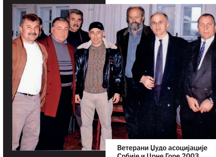
Ветерани Џудо асоцијације Србије и Црне Горе 2003.