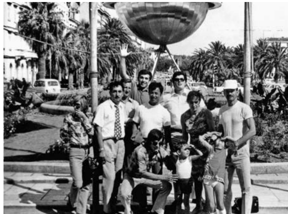
На семинару код Јамамота

– Опредељење Европске и Светске џудо федерације јесте да се максимално подржи такмичење у дисциплини такмичења мајстора – објашњава Вук дугу такмичарску каријеру и чињеницу да је у Бечу 2004. године освојио злато после четири борбе које су све заједно трајале мање од 60 секунди. Победе су често праћене овацијама, као последњи пут поводом освајања медаље „Шампион Чешке“, пре двадесетак дана. Мало је познато да су управо ова првенства међу најмасовнијим, на турнирима се појави око 1.000 такмичара,