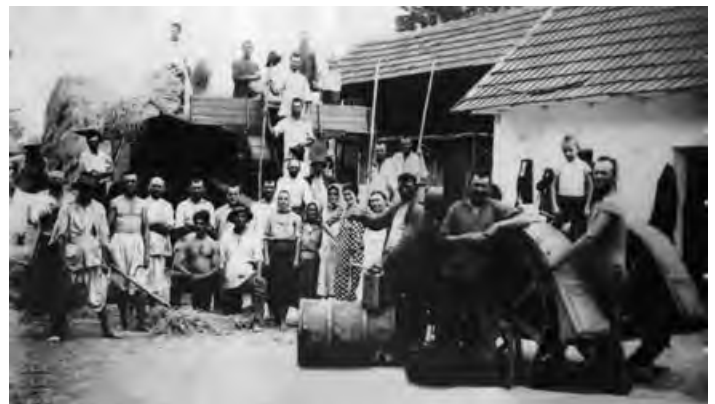
Од слике из 1939. све је почело

један је од најстаријих домаћих модела код нас. Интересантно је да је још у возном стању, као и већина музејских експоната.