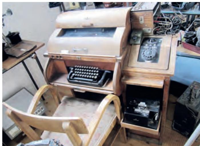
Телекс преко кога су стизали текстови за новине

– Био ми је неопходан новац за алат да поставим радионицу на ноге, тек сам 1980. године потписао уговор са „Бошом”, док је он сваки динар улагао у своју пасију – признаје наш саговорник, који је наставио породичну традицију механичарског заната, ону коју је деда започео тридесетих година прошлог века. Није било лако, али породица Жеравица је несумњиво