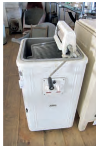
Машина за прање веша