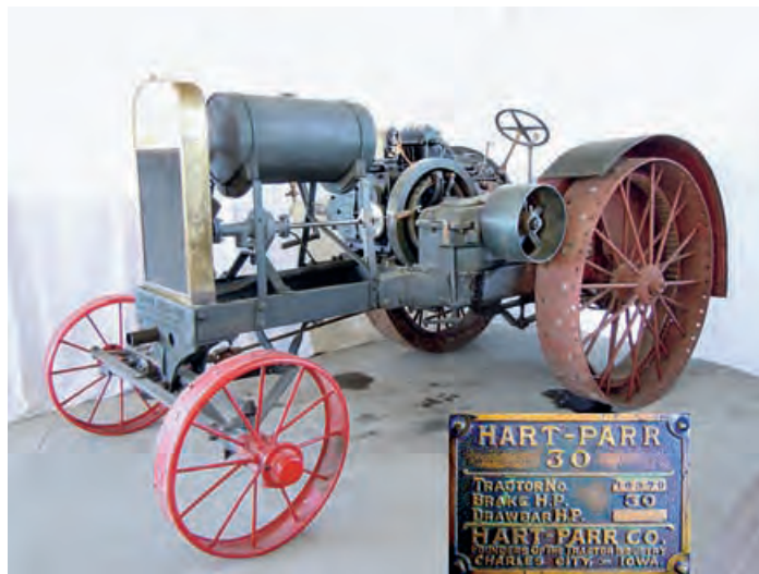
Трактор „харт-пар” произведен 1920.

Одлазио сам у Немачку више пута и на све могуће начине убеђивао власника да ми позајми неколико мањих делова који су недостајали на мом трактору како бих направио дупликате и оспособио га да буде као некада када је изашао из фабрике – истиче наш домаћин и додаје да су јесенас покренули вршалицу уз