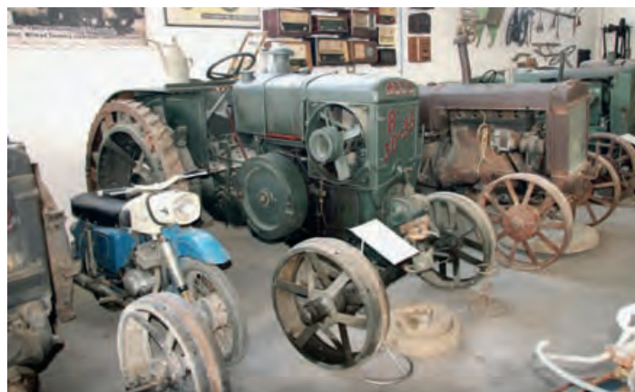
Први пут су изложени 1991. године