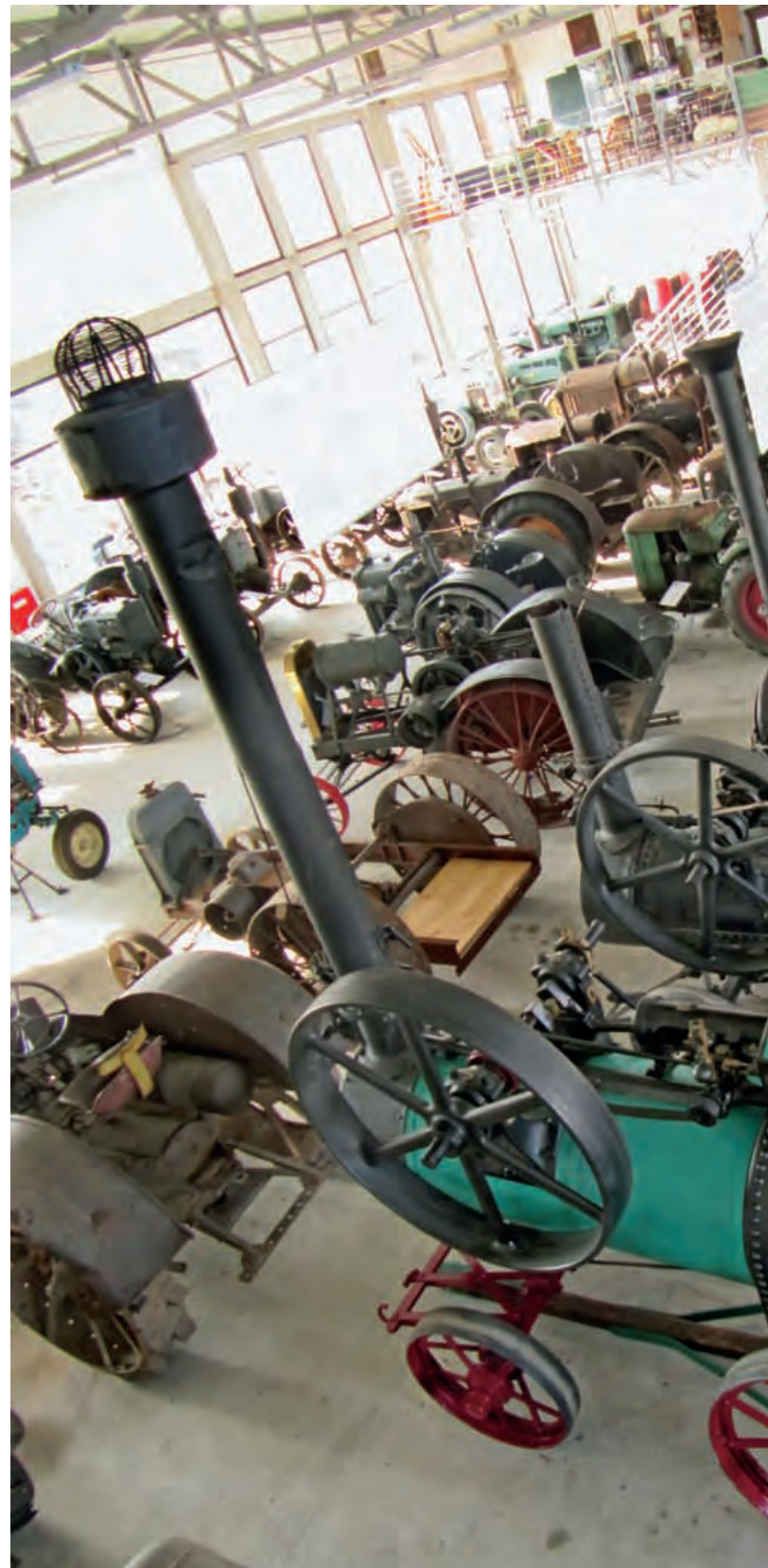
На једном месту 133 трактора и других експоната

– Све је почело тако што је мој отац Миливој 1970. отворио кофер у коме су биле старе