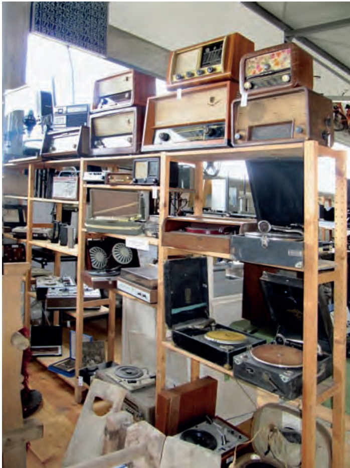
У збирци су и грамофони, радио апарати, магнетофони...