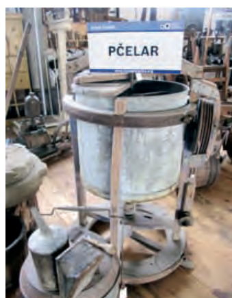
Алат за пчеларе