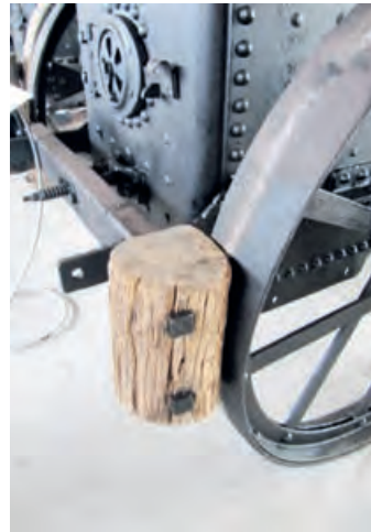
Кочница од дрвета