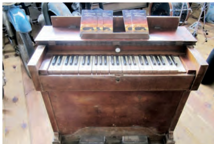
Има и музичких инструмената