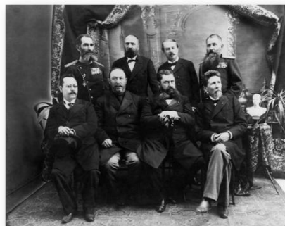
Кабинет Владана Ђорђевића 1898. (САНУ, XXVI)

Председник Министарског савета и министар иностраних дела (1897 – 1900)